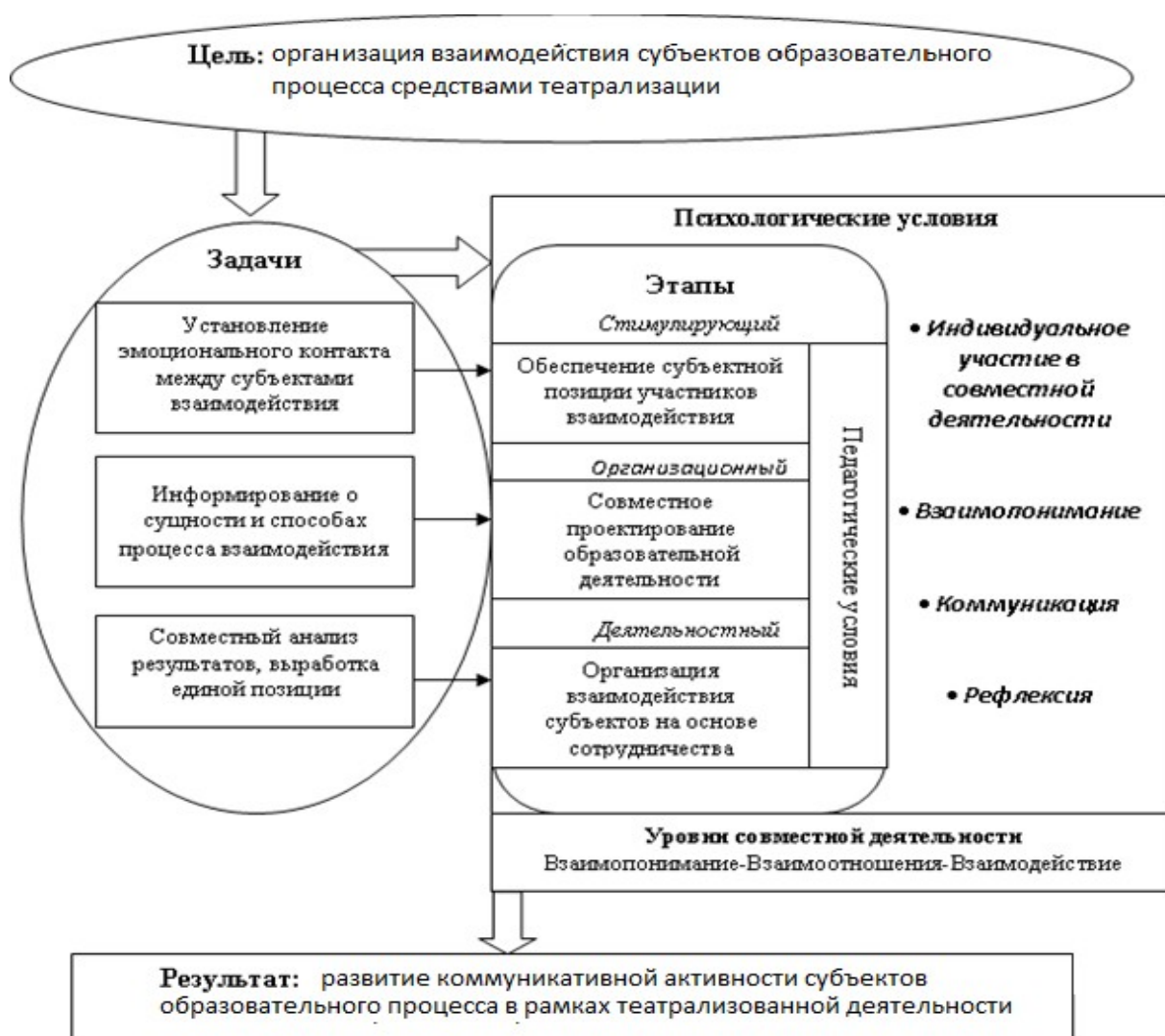
Рис 2. Процессуальная модель организации взаимодействия субъектов образовательного процесса средствами театрализации

Процессуальная модель исследуемого процесса взаимодействия включает в себя ряд связанных между собой блоков: концептуальный (цели, задачи), организационно-деятельностный (этапы, педагогические и психологические условия), результативный (уровни совместной деятельности, результат).